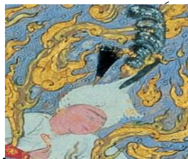
شکل ۳. پوشش سر سیاوش هنگام گذر از آتش در نگاره «گذر سیاوش بر آتش»

در متن شعری شاهنامه، سیاوش هنگام گذر از آتش کلاخودی طلایی به سر دارد؛ درحالی که در نگاره چنین کلاخود طلایی تصویر نشده است (شکل ۳). سیاوش بیامد به پیش پدر یکی خود زرین نهاده به سر