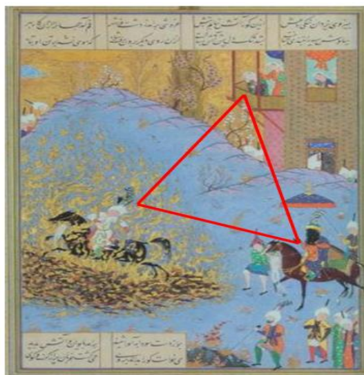
شکل ۲. نگاره «گذر سیاوش بر آتش»، مکتب دوم تبریز، شاهنامه طهماسبی، ۹۲۶ق، محل نگه‌داری موزه هنرهای معاصر تهران

همی کند سوداوه از خشم موی همی ریخت آب و همی خست روی چو پیش پدر شد سیاوش پاک نه دود و نه آتش، نه گرد و نه خاک فروآمد از اسپ کاووس شاه پیاده سپهبد پیاده سپاه سیاوخش را تنگ در بر گرفت زگردار بد، پوزش اندر گرفت سیاوش، به پیش جهاندار پاک بیامد بمالید رخ را به خاک که از آن تَقَفِ آن کوه آتش برست همه کامه دشمنان گشت پست ابیات فوق به اختصار وقایع نگاره را به تصویر می‌کشد که به نوعی بیانگر بخش نخست داستان سیاوش در شاهنامه است.