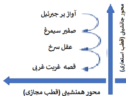
شکل ۴. روابط استعاری عناوین با یکدیگر در آثار شیخ اشراق

علاوه بر ماهیت استعاری خود عنوان‌ها و ارتباط استعاری متن‌ها با عنوانشان، یک رابطه استعاری دیگر در عناوین آثار سهروردی وجود دارد و آن رابطه جانشینی خود عنوان‌ها با یکدیگر است. اگر عنوان آواز پر جبرئیل متن این اثر را نمایندگی می‌کند و عنوان عقل سرخ متن اثری دیگر را، به سبب پیوند موضوعی این آثار — که همگی بازگوکننده فلسفه اشراقی سهروردی‌اند — این عناوین یکدیگر را نیز نمایندگی می‌کنند و می‌توان آن‌ها را در جای هم دانست. همه این آثار قصه سلوک و دیدار سالکی درمانده و اسیرگشته با پیری است که سالک را به واسطه اشراق و نورآگاهی به سرمنزل مقصود می‌رساند.