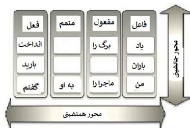
شکل ۱. محور جانمایی و هم‌نشینی