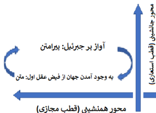
شکل ۳. روابط استعاری متن و پیرامتن در آثار شیخ اشراق

و متن خود را نمایندگی کنند. در این موارد، رابطه بین متن و عنوان رابطه‌ای است مبتنی بر جانشینی، جایگزینی، نماد و استعاره. عنوان در اینجا متن خود را نمایندگی می‌کند و می‌تواند خلاصه متن خود باشد. اما عناوین آثار غیرعرفانی را در نظر بگیرید: قابوس‌نامه، چهارمقاله، خسرو و شیرین، سفرنامه و... این دسته از عنوان‌ها به جای برقراری ارتباطی بر مبنای استعاره/ تشبیه یا جایگزینی با متن خود، رابطه هم‌جواری و هم‌نشینی دارند. هنگامی که عنصری از عناصر متن، از جمله شخصیت یا مکان، در جایگاه عنوان متن قرار گیرد، ارتباط متن و عنوان بر پایه مجاز است (جزء به جای کل) است؛ از همین روست که این عنوان‌ها ماهیت درونی متن را تداعی نمی‌کنند و نمی‌توانند نماینده کلیت مفهوم متن خود باشند.