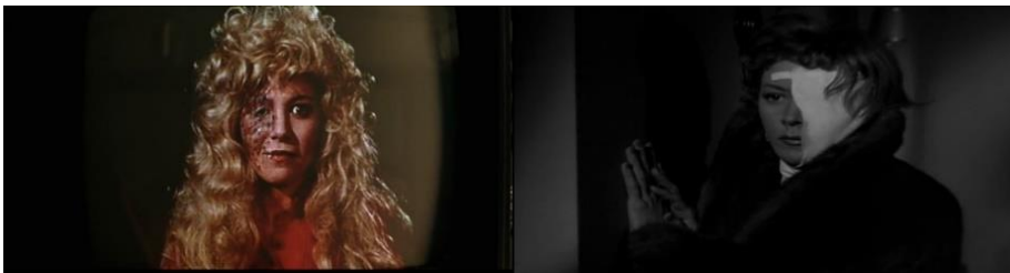
تصویر ۱: راست: نمایی از فیلم تعقیب بزرگ / چپ: نمایی از فیلم چه کرده ام که مستوجب این باشم؟

این سکانس یکی از سکانس‌های کلیدی در فیلم فریتز لانگ است که حتی در برخی از پوستره‌های این فیلم نیز بر آن تأکید شده است. آلمودوار به زیرکی آن را پارودی کرده است؛ پیش‌متن مورد نظر فیلم تعقیب بزرگ است و پاره‌متن پارودی شده آن، سکانس پاشیدن قهوه و سوختن صورت بازیگر است. سبک به واقع کاملاً تنزل پیدا کرده و در راستای تفنن همراه با شوخی، به یک تبلیغ ساده تلویزیونی تقلیل یافته است؛ نوعی تراگونگی سبکی که ژنت به آن اشاره داشته است. پارودی نه در بطن فیلم، بلکه در یک رسانه دیگر (تلویزیون) گنجانده شده و خاصیت خودبازتابندگی نیز دارد. تبلیغ به خودی خود مضحک است، ولی همانگونه که ذکر آن رفت کارکرد آن با آگاهی از پیش‌متن است که محقق می‌شود. «در پارودی همواره متن دوم با متن نخست با هم به دلالت‌پردازی می‌پردازند. چنانچه متن نخست ناشناخته باشد، گونه پارودی یا پاستیش نیز پنهان خواهد ماند» (نامور مطلق، ۱۳۹۴، ص. ۴۴) (تصویر ۱).