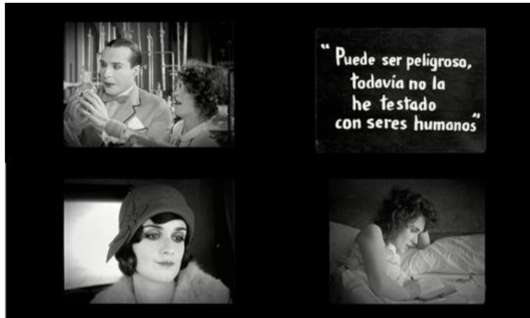
تصویر ۴: پارودی آمیخته: نماهایی از با او حرف بزن (۲۰۰۲)

و حتی یک ژانر شناخته‌شده سینمایی، پارودی آمیخته را به کار می‌گیرد؛ همانگونه که در مرحله اول و سپس تراگونگی در مرحله دوم (تصویر ۴).