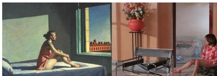
تصویر ۳: راست: فیلم زنان در آستانه فروپاشی عصبی/چپ: نقاشی آفتاب صبح

در سکansı دیگر از همین فیلم، پیا روی نیمکتی در خیابان می‌نشیند و با نگاهی کنجکاوانه پنجره‌ها و بالکن‌های ساختمان روبه رو را دید می‌زند. در این سکانس نیز آلمودوار از پارودی هاچنی بهره می‌برد؛ این سکانس ادای احترامی به فیلم پنجره عقبی (۱۹۵۴) هیچکاک است؛ مردی که در آپارتمان خود نشسته و از پنجره اتاقش رفتار تمام همسایگان را زیر نظر دارد و چشم‌چرانی می‌کند. فیلمساز با توسل به وارونه‌سازی آرونیک و فرا بافت‌سازی، کاراکتر مرد را تبدیل به زن کرده و این‌بار نگاه خیره را در اختیار زن قرار می‌دهد و فرایند نظربازی را وارونه می‌کند. در واقع معنای متن در بافت جدید تغییر پیدا می‌کند و نوعی رمزگذاری می‌شود و مخاطب بایستی بافت یا زمینه اصلی را تشخیص بدهد.