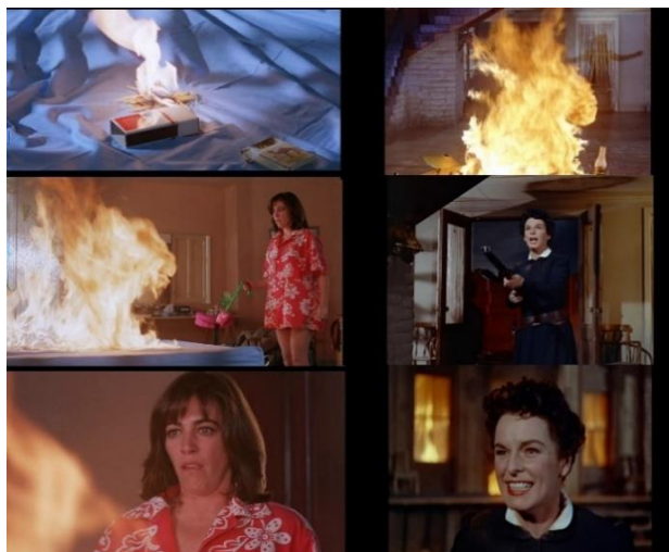
تصویر ۲: راست: فیلم جانی گیتار/ چپ: فیلم زنان در آستانه فروپاشی عصبی

آلمودوار با وارونه‌سازی عناصر سکانس فیلم مطرح نیکلاس ری، فرامتن‌سازی می‌کند که همان تکرار همراه با تفاوت است؛ در عین حال ژانر وسترن و فیلم کلاسیک را نیز تکریم می‌کند. این همان نشانه‌گذاری مثبت مقصود هاجن است؛ «نشانه‌گذاری بسیار مثبت اخلاقیات پارودی ناشی از احترامی است که بسیاری از هنرمندان در برخورد پارودی‌آمیز خود با شاهکارهای شناخته شده هنر مدرن نشان می‌دهند» (Hutcheon, 1985, p. 59). در اینجا آلمودوار به شیوه‌ای محترمانه عناصر پیش‌متن را دستکاری کرده و آن را مجدد بازسازی می‌کند (تصویر ۲).